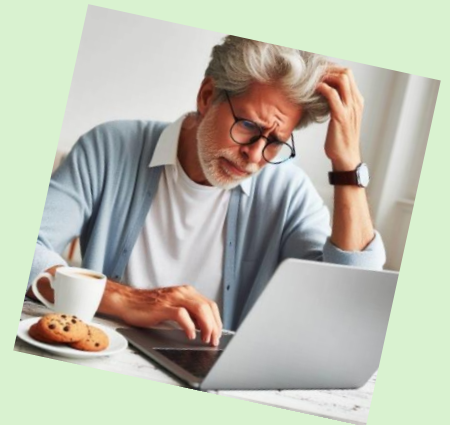
PC helpdesk gehele jaar