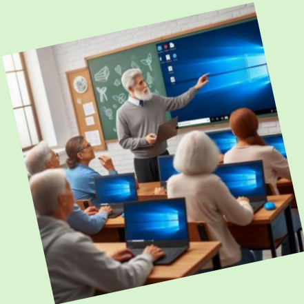
Klassikale workshops in voorjaar en najaar