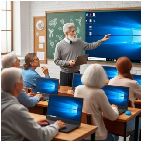
Klassikale workshops in voorjaar en najaar