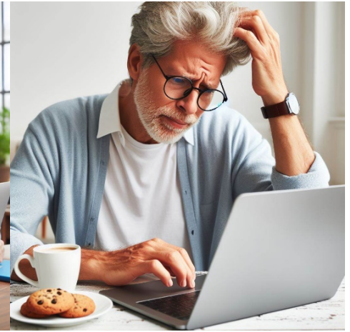
PC helpdesk gehele jaar