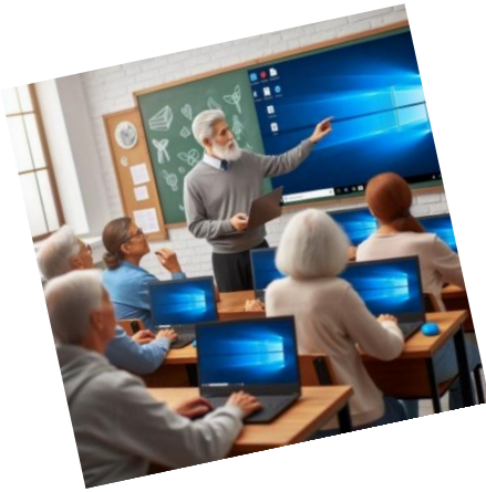
Klassikale workshops in voorjaar en najaar