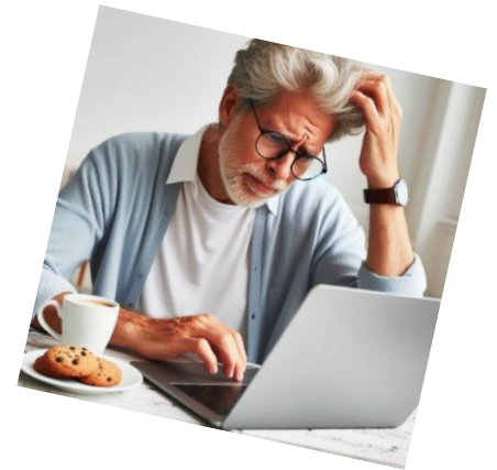
PC helpdesk gehele jaar

A. Klassikale workshops in de Blaercom Blaricum: Workshopprogramma en aanmeldgegevens in deze folder